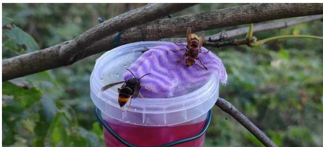
Asiatische und europäische Hornisse am Locktopf